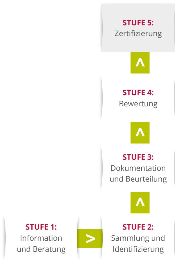
Abbildung: Vierstufiges und vollständiges fünfstufiges Validierungsverfahren

Demgegenüber dominiert in Unternehmen ein vierstufiges Verfahren, das, wie die nachstehende Abbildung zeigt, mit Bewertungen abschließt. Die Bewertungen erfolgen in unterschiedlichen Formen, z.B. in Form von Qualifikationsnachweisen, Kompetenzprofilen und Badges bzw. Lernabzeichen, die als „Open Badges“ digital vorgenommen werden.